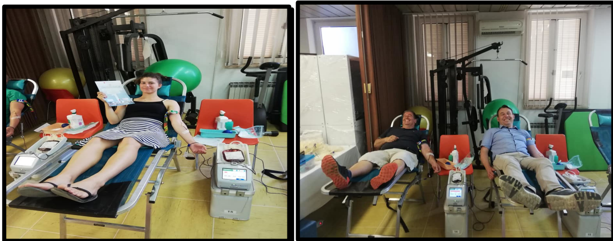
Slike: Akcije darivanja krvi

Gradsko društvo Crvenog križa Krk svoje darivatelje animira na način da: